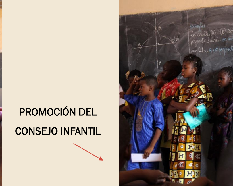
PROMOCIÓN DEL CONSEJO INFANTIL