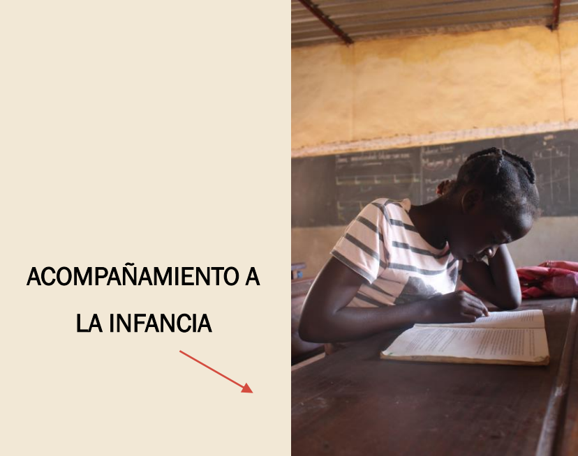
ACOMPañAMIENTO A LA INFANCIA